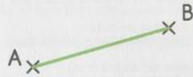
Le segment qui relie A à B